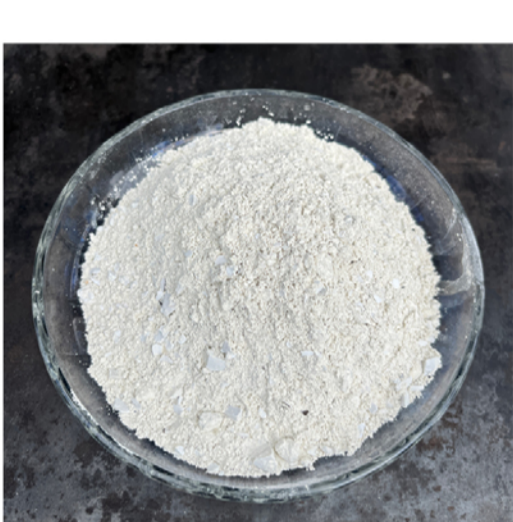
Weißer Tonerde, der Rohstoff für den hochfeuerfesten RÖMEROFEN-ZEMENT

Dessen Dichte ist vergleichbar mit Lehm und damit deutlich niedriger als die der üblichen Ofenschamotte. Durch seine herausragende Speichereigenschaft verwandelt dieses relativ leichte Material die Verbrennungshitze des Feuers in eine sanfte, besonders weitreichende Infrarot-Wärmestrahlung.