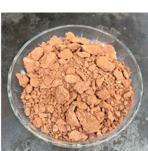
Natürlicher Lehm – unser Vorbild in punkto Wärmestrahlung

Weil sie statt der Raumluft primär die Gebäudemasse wärmt, verbreitet sie sich im ganzen Haus, ohne den Aufstellraum zu überhitzen.